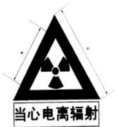
图 F2 电离辐射警告标志

电离辐射的警告标志如图 F2 所示。警告标志的含义是使人们注意可能发生的危险。其背景为黄色，正三角形边框及电离辐射标志图形均为黑色，“当心电离辐射”用黑色粗等线体字。正三角形外边 a_1=0.034L ，内边 a_2=0.700a_1 ， L 为观察距离。